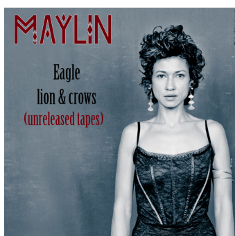
«Eagle Lion & Crows» (2016)