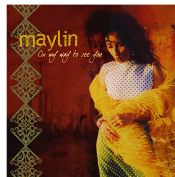
«On My Way To See You» (2005)

Contact : Before June +33/(0)6 78 62 68 67, contactbeforejune@yahoo.fr