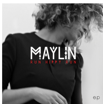
«Run Hippy Run» (2013)