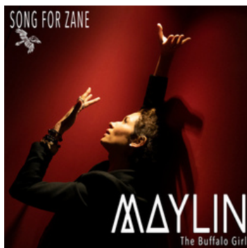
«Song For Zane» (2022)

Sur scène, Maylin incarne un personnage, qui est un mélange entre femme, corbeau et arbre : Buffalo girl. Buffalo girl, son alter-ego, telle une super-héroïne, est un être fantasmé sorti de la terre qui a pour mission de reconnecter son entourage envahi par une technologie aux effets parfois destructeurs, aux coutumes et valeurs ancestrales des peuples racines, en réintroduisant la notion de communion et de lien respectueux avec la nature dans le quotidien. Le désir de cheminer vers une authenticité personnelle et d'exprimer sa dignité ainsi que celle de ceux qui souffrent la pousse à créer. Ainsi, elle encourage les autres en s'appuyant sur le pouvoir guérisseur des vibrations de la voix humaine.